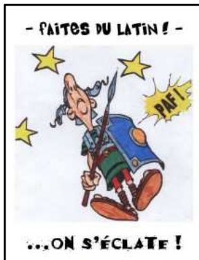
Les deux affiches publicitaires ont été réalisées par des élèves

Personne, elle s'est formée à partir d'une langue appelée l'indo-européen (qui s'étendait de l'Europe jusqu'en Inde). Elle s'est transformée petit à petit en subissant l'influence des langues plus locales (des patois). Le latin qu'on a l'habitude d'apprendre est le latin « classique » que les grands auteurs utilisaient comme Jules César ou Cicéron. Mais le latin n'est pas figé. Il a évolué et évolue encore puisque des livres sont édités en langue latine comme des BD, Astérix, Tintin ou des romans comme Harry Potter.