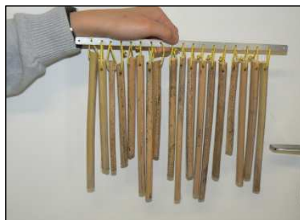
L'un des improbables instruments

Grâce aux conseils prodigués par Cédric MONJOUR, musicien, et Henri-Pierre DEROUX, plasticien sonore, les élèves composent des cellules rythmiques, jouent les hommes orchestres et se parent d'armures musicales.