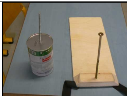
Quel son cela peut-il bien produire ?

*La formation Sillages est un des ensembles contemporains professionnels qui comptent en Europe. Fondé par Philippe Arri-Blachette, Sillages , en résidence au Quartz, a joué en Europe et jusqu'aux Amériques la musique classique contemporaine.