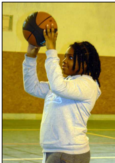
Tir au panier

Toutes ces activités sportives sont importantes. La natation est un sport éducatif qui permet d'apprendre tout en s'amusant et qui permet aussi de surmonter sa peur pour certains. La danse est un sport mixte même si elle est surtout pratiquée par les filles.